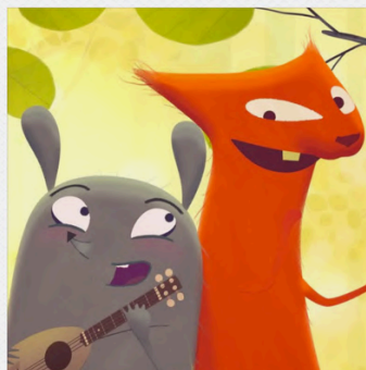
YUKU E IL FIORE DELL'HIMALAYA

di Jean-Loup Felicioli e Alain Gagnol (Francia, Lussemburgo, 2023) durata: 82'