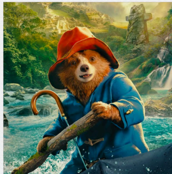
PADDINGTON IN PERÙ

di Chiara Malta e Sébastien Laudenbach (Francia, Italia, 2023) durata: 76'