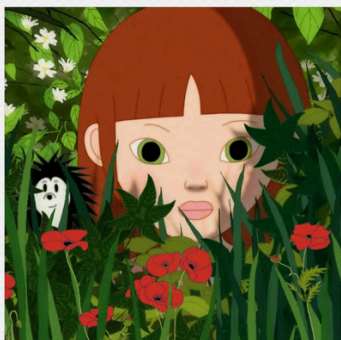
NINA E IL SEGRETO DEL RICCIO

di Dougal Wilson (Gran Bretagna, Francia, USA, 2024) durata: 106'